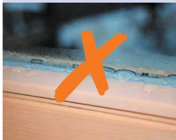
▲ Hygieneprobleme durch Tauwasser- oder Schimmelbildung am Glasrand werden durch sgg SWISSPACER stark reduziert